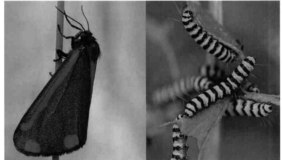
Blutbär ( Thyria jacobaeae ), Schmetterling und Raupen

Bewusst wird im Herbst nicht alles gemäht, damit Kleintiere, vor allem Heuschrecken und Spinnen, einen Teil ihrer Nahrungsgründe, Kinderstuben und Überwinterungsplätze behalten können. Die seltene Grosse Schiefkopfschrecke ( Ruspolia nitidula ), welche in jüngster Vergangenheit am Pfäffiker- und am Greifensee entdeckt wurde, profitiert von den ungemähten Streifen. Ihre langgestreckte schlanke Gestalt wird noch durch den nach vorne gerichteten Kopf und die über körperlangen Fühler betont.